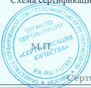
Схема сертификации: №3.